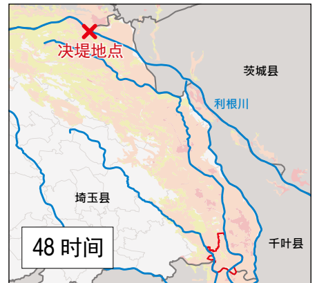
从决堤开始算 48 小时内市内全域浸水