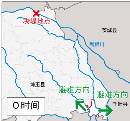
在利根川上流发生决堤