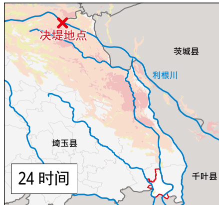
从决堤开始算 24 小时后洪水到达八潮市