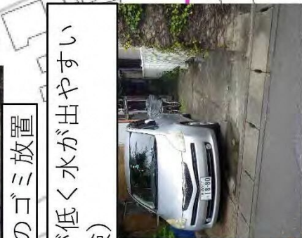
空家のゴミ放置 土地が低く水が出やすい (危険)