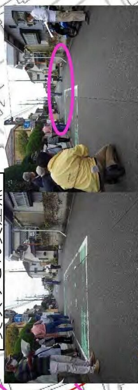
美咲うどん交差点