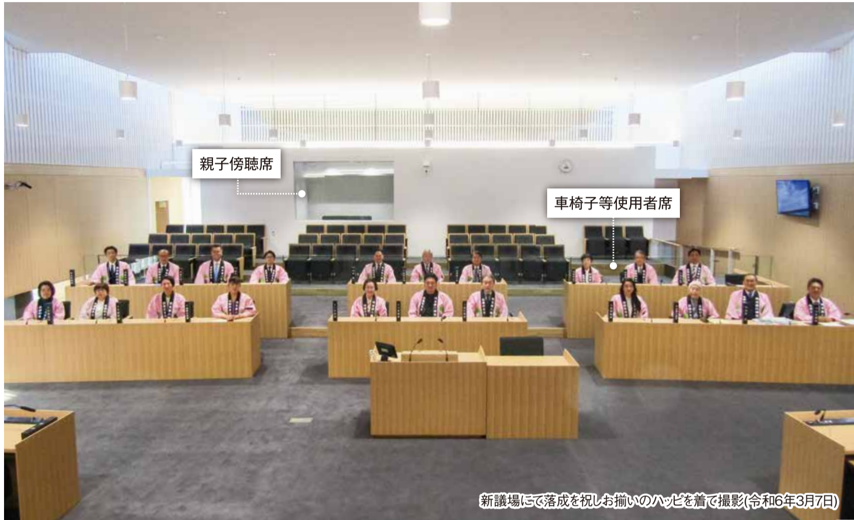
新議場にて落成を祝しお揃いのハッピを着て撮影(令和6年3月7日)