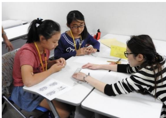
<貿易シミュレーションゲーム>