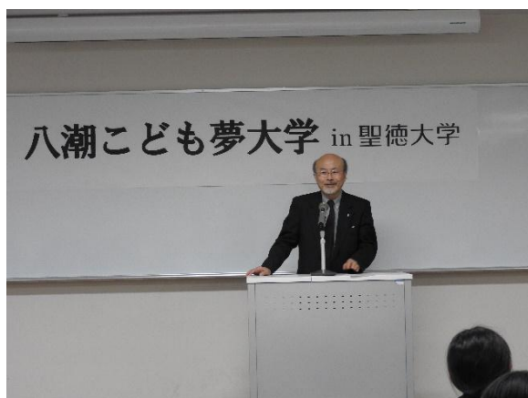
<英語で足し算、引き算を教わる>