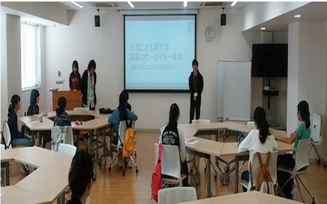
<キャッチコピーを作る>