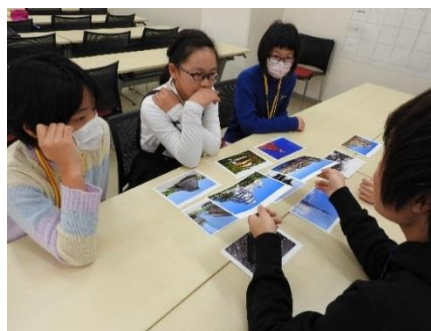
<時代ごとの建物を検証>