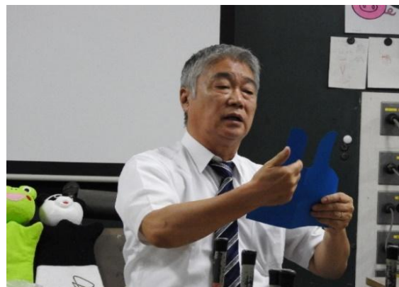
<子どもの表現活動>