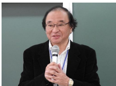
<宇佐美人文学部長の挨拶>