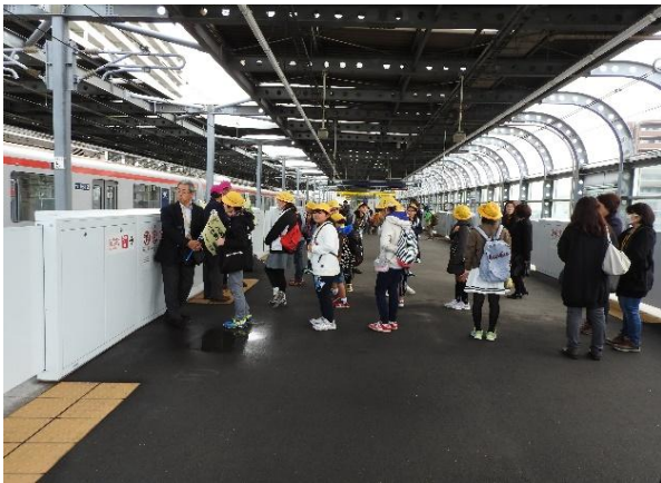
＜八潮駅で電車を待つ＞