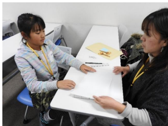
<音楽の不思議体験・クイズでチャレンジ>