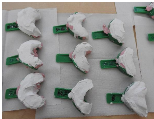
<みんなが作成した歯型>