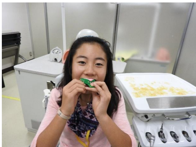
<歯型が固まるまで待つ>