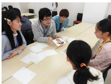
<大学生と一緒に考える>