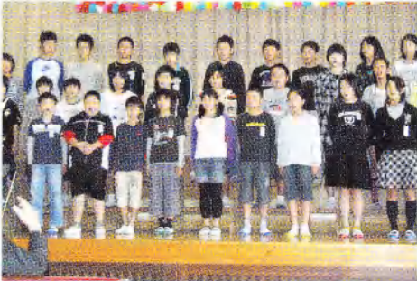
小学生が中学校の合唱祭に参加し、精一杯歌声を響かせました。