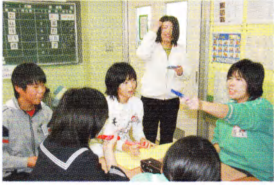
中学校新入生一日入学