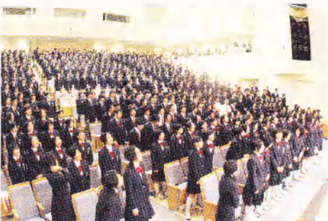
中学校の合唱祭に小学生が参加し、審査員として真剣に聞いていました。