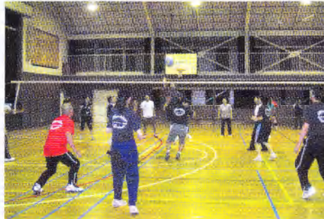
3校の保護者、教職員が合同のバレーボール大会で盛り上がりました。