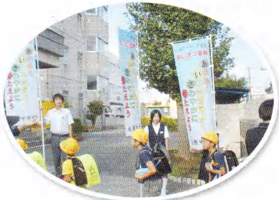
朝のあいさつ運動