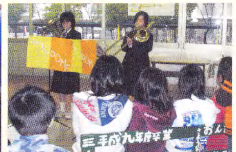
中学生によるミニコンサート