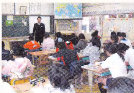
中学校で小学生が社会科の先生による授業で地理を学習しました。