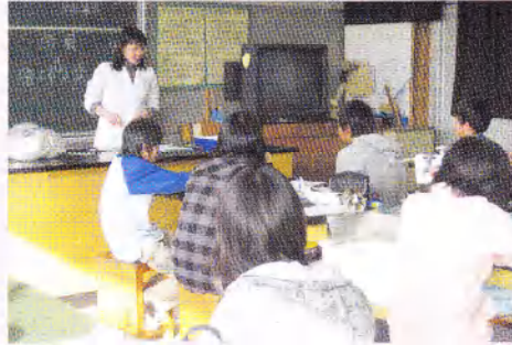
小学生が中学校の理科室で天気の授業を受け、実験に挑戦しました。