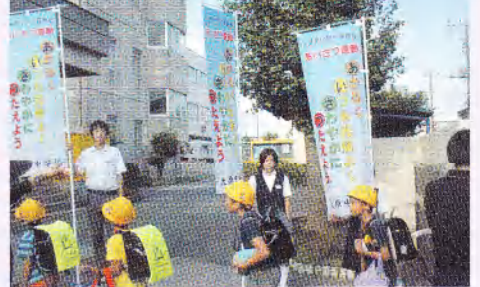
中学生が小学校に出向き、あいさつ運動を元気良く行いました。