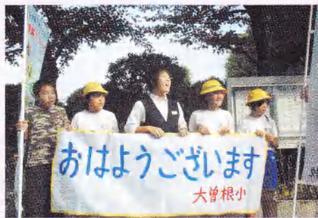
小中学生が合同で朝のあいさつ運動を、中学校で元気よく行いました。