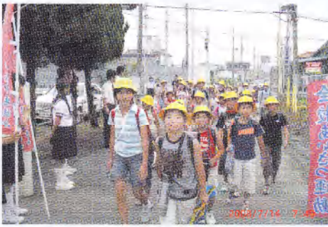
中学生が小学校で朝のあいさつ運動を行い、笑顔で迎えました。