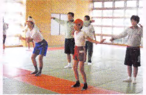
小中学生が合同で体育の授業を行い、リズムダンスを一生懸命行いました。