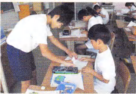
中学生が社会体験チャレンジを小学校で行い、学習のサポートを行いました。