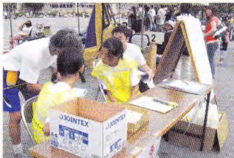
中学生が小学校の運動会にボランティアで受付係として活躍しました。