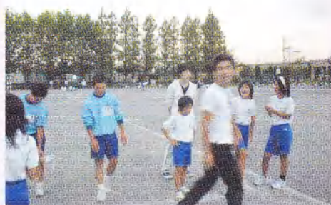
小学生と中学校の陸上部員が合同で練習会を行いました。