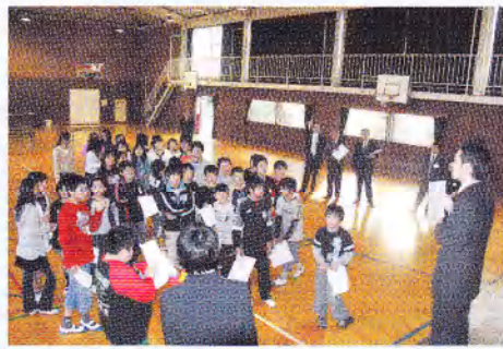
中学校の英語の先生とALTによる英語活動に小学生は元気いっぱいでした。