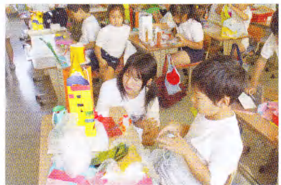
中学生4days体験チャレンジ