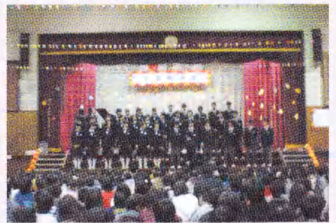
小学校の学習発表会に中学生が参加し、合唱を響かせていました。