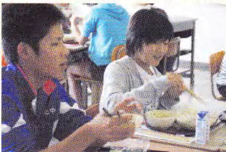
小6年生と中3年生と一緒に給食