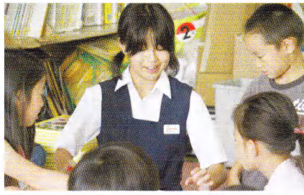
小学生サマースクール(中学生のサポート)