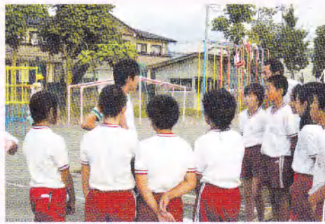
小学生が陸上競技大会に向けた練習で、中学生のアドバイスを真剣に聞きました。