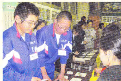
小中学生合同の英語活動