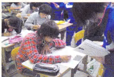
国語の合同授業で学び合い