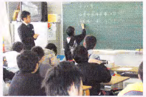
小学生が中学校で数学の授業を受け、見事に問題を解きました。