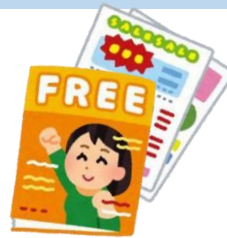
チラシ・カタログ