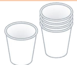
防水加工された紙