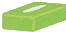
ティッシュの紙箱