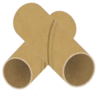
トイレトペーパーの芯