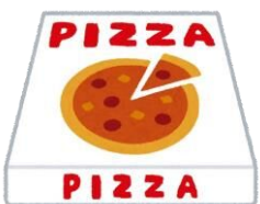
汚れ・においのついた紙