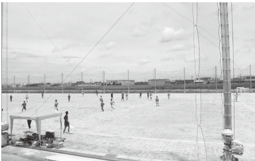
多目的広場Aの様子