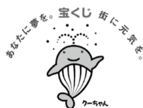
▲宝くじ「くわちゃん」マーク