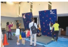
スポーツフェスティバル