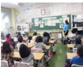
栄養士による食育授業