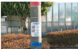
想定浸水深表示看板の設置