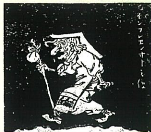
インフルエンザ之像『国民新聞』第106号 (明治23年5月17日)より

人びとは未知の見えない病を鬼や悪霊がもたらしたものと考えることで恐怖心を解消しようとしてきました。病の可視化、時には祈りの可視化により、病を遠ざけようとしたのです。