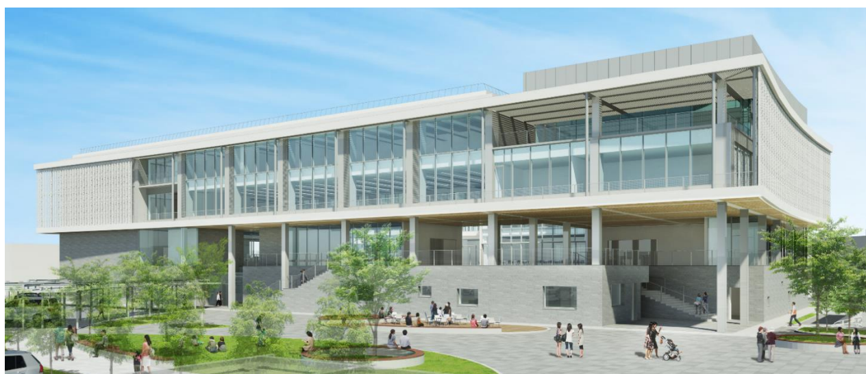
北西からの新庁舎全景イメージ