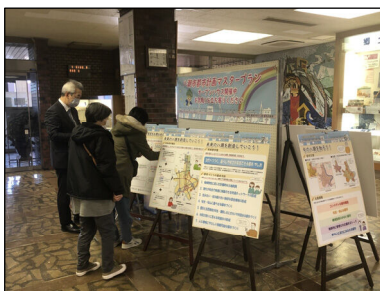
八潮市役所（1階ロビー）