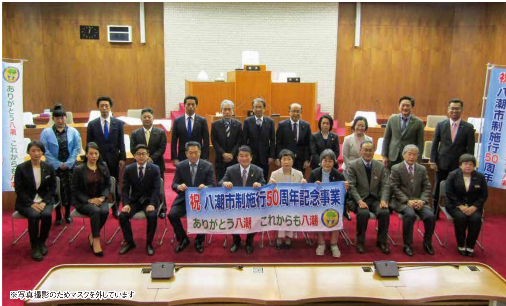
※写真撮影のためマスクを外しています