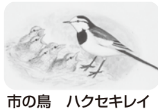
市の鳥 ハクセキレイ