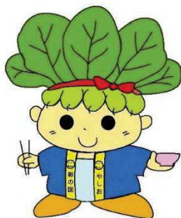
ハッピーごまちゃん®