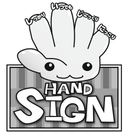
道路横断時の安全行動イメージキャラクター「サイン(SIGN)ちゃん」