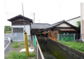
旧用水路・ 建屋(西側)

また、中川からの流入路は、安全のために埋め立てられ、現堤防下の樋管は、河川法の占用許可条件上、「 目的を終えた後はすみやかに撤去し、堤防を原形に復旧すること 」とされていますが、文化財的価値も評価されていることから、樋管内部を充填して残すことができないか、国土交通省と協議を重ねています。