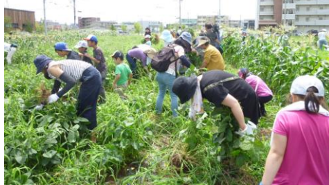
平成28年7月18日(土) 第8回夏野菜旬採り合戦

も変わってきていますが、東京市場に隣接した立地環境を活かし、付加価値の高い農業経営を積極的に推進することが必要かと思えます。今後とも、八潮市の農業振興のため、会員の皆様のご協力をいただきながら、都市農業の発展を推進してまいりたいと思えます。