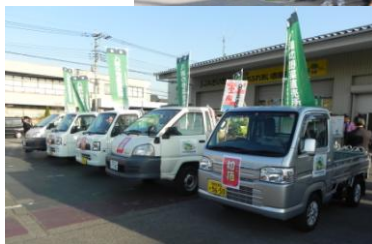
平成28年1月7日(木) 初荷パレードの様子