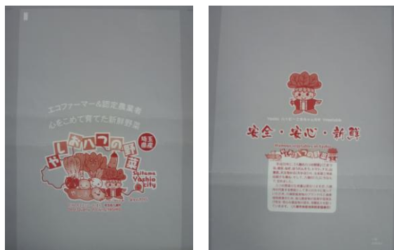
「FG袋」 表 (左)、裏 (右)