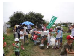
夏野菜旬取り合戦