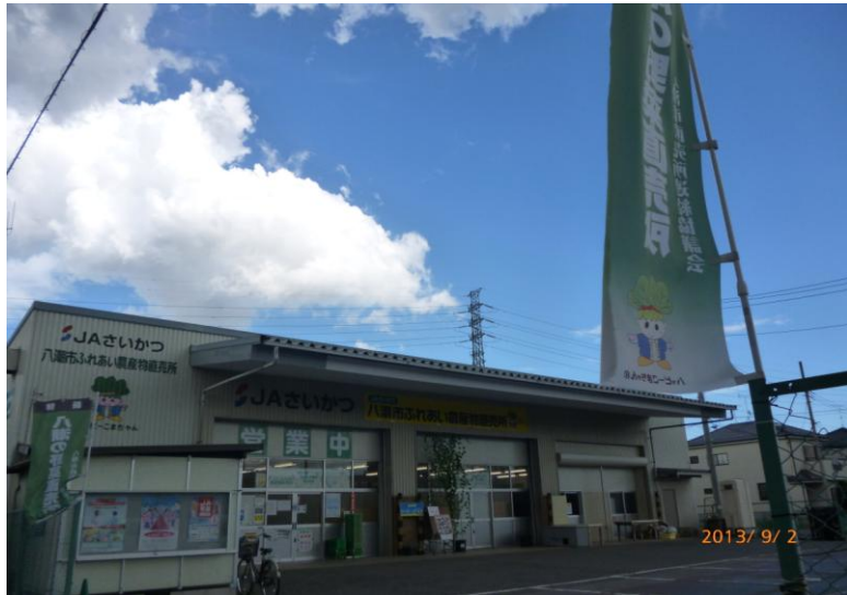
八潮市ふれあい農産物直売所 (JAさいかつ)

これからも、直売所においては、市民の皆様へ「安全・安心・新鮮」をモットーに農産物の提供を行い、日々頑張つて参りたいと思ひます。