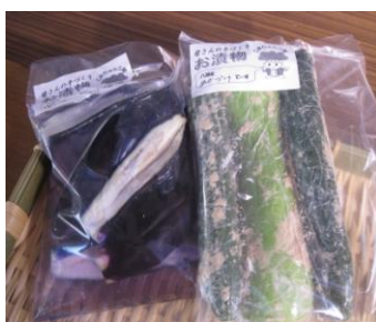
キュウリ・なすの漬物 (小林 よし)