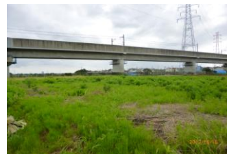
(つくばエクスプレス中川高架周辺)