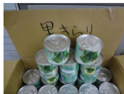
コマツナ種の共同購入

八潮市園芸協会を始め、多くの農業者のご協力を頂きながら、本協議会の発展に努めて参りたいと考えています。