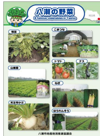
【八潮の八つの野菜】

これは可能性にかけることであり、努力をしていかなければならないことが、沢山あると思います。天かぶという題材は見つかりました。これをどう料理して未来につなげていくか。皆さんはどう思いますか？