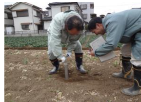
八潮二丁目地内の畑で土壌採取 （平成25年2月19日）