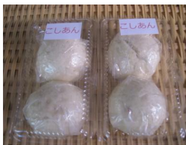
八潮名産小麦まんじゅう (小倉 操子)

私は、このおまんじゅう作りを、次世代に伝えて八潮の伝統食として残して行きたいと思っています。