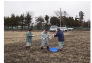
八條地内の田んぼで土壌採取 （平成25年2月19日）

埼玉県により、市内の田んぼと畑の土壌測定を実施した結果、土壌中の放射性セシウムは、全て基準値以内でありました。 *測定の結果は、県HPで公開しておりますのでご覧ください。