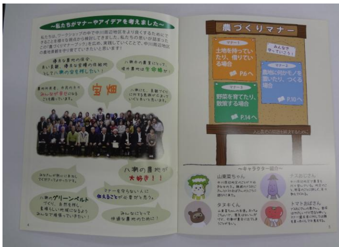
農づくりマナーブック