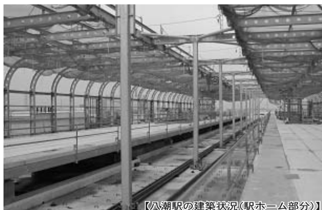
【八潮駅の建築状況(駅ホーム部分)】