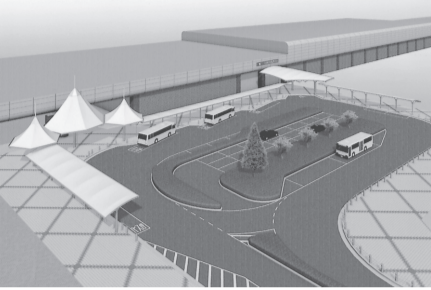
駅南口交通広場完成予想図

市では、にぎわいがあり、人にやさしく、市民に愛される魅力あるまちづくりを目指し、埼玉県や都市再生機構と一緒に鉄道沿線の整備（八潮南部一体型特定土地画整理事業）を進めています。