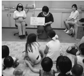
外国語絵本のおはなし会