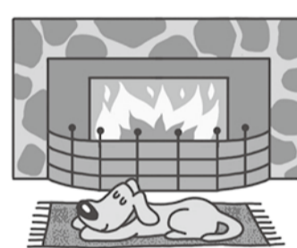
●冬場に多発する入浴中の事故(ヒートショック)にご用心

①骨粗しょう症検診 ①2月5日(月) 午前10時~10時30分 午前10時45分~11時15分 結果説明会 ②2月28日(水) 午前10時 ~11時30分(初回の受診者のみ) ③市内在住で20歳以上の女性の方 ④内問診、骨密度測定 ⑤定各25人(申込順) ⑥費200円 ②ヘルシーチェック健康診査 ①2月5日(月) 午前9時~9時45分 結果説明会 ③3月5日(月) 午前9時 ~9時45分 ④市内在住で20歳~39歳の方(妊婦 を除く) ③健康づくりの料理教室 ①2月19日(月) 午前10時~午後1時 30分 ②市内在住で64歳以下の方(調理未 経験者歓迎) ③「腸内フローラって何?」免疫力 アップをめざして」をテーマに調 理実習と講話 ④定20人(申込順)