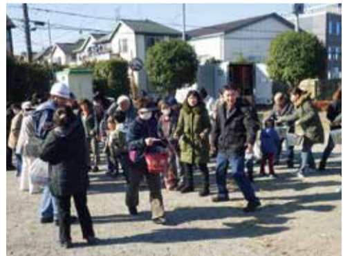
上二丁目町会自主防災組織防災訓練の様子