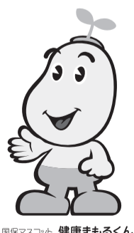
国保マスコット 健康まるくん