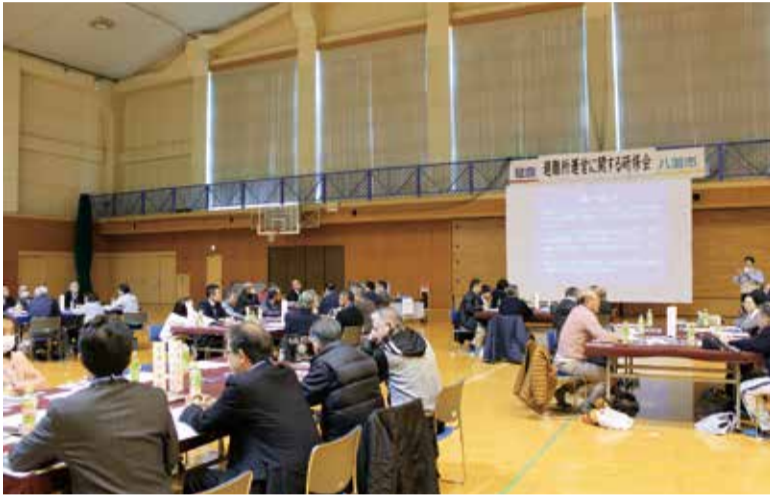
2月24日にエイトアリーナで避難所運営に関する研修会の様子