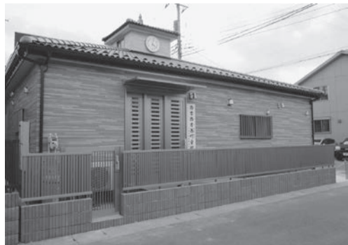
西古新田町会会館

西古新田町会と下大瀬町会では、埼玉県ふるさと創造資金の補助を受けて、コミュニティ活動の拠点となる町会会館を建設しました。