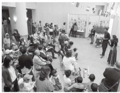
多文化交流事業の様子

外国人市民の生活実態やニーズ、地域コミュニティに参画しやすい環境などを把握するために、調査を実施しました。調査結果は、今後の事業に生かしていく予定です。