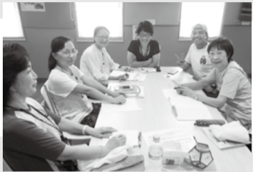
日本語教室の様子