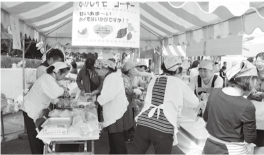
▲市民とのふれあいの様子(市民まつり)

生活上の困り事や不安に思っている事をぜひ民生委員に相談してください。民生委員は守秘義務が法律によって定められているため、相談内容や秘密が他に漏れることはありません。また、担当する民生委員は、相談者の住所により変わりますので、社会福祉課へお問い合わせください。