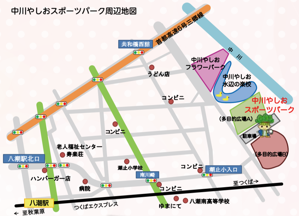
中川やしおスポーツパーク周辺地図