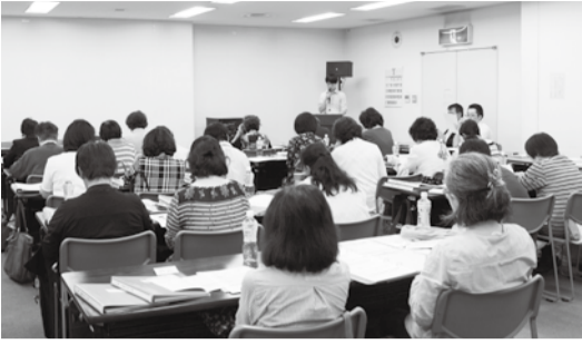
▲研修会のような様子

が、地域の皆さんと同じ立場で相談を受け、問題解決に向けて適切な機関へとつなぐ重要な地域のパイプ役として働いています。安心・安全に生活できる地域を目指し、近年増加している一人暮らし高齢者の見守りや児童への声掛けなど、地域住民に根ざした活動をしています。