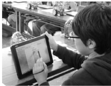
タブレットを使ったプログラミングの授業(算数)の様子