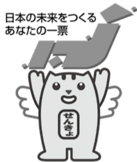
日本の未来をつくる あなたの一票

請求期限は、7月17日(水)午後5時必着です。 ●代理投票・点字投票 字を書くのに不便を感じる方、視力に障がいのある方は、