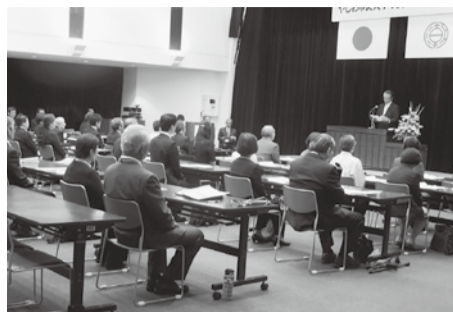
▲やしお市民大学および大学院の入学式

▼4月8日から26日までの間、市役所1階ロビーで、町会・自治会加入促進月間と多文化共生支援の一環として、各町会・自治会の活動と多文化共生の取り組みについて展示▼5月1日現在の児童・生徒数は、6543人、学級数は、231学級