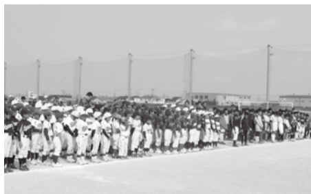
▲中川やしおスポーツパークオープニングイベント開会式

▼だれもが生涯を通じて、身近な場所でスポーツに親しみ、楽しむことができるまちづくりを推進するため、3月に「八潮市スポーツ推進計画」を策定 ▼3月19日から4月16日までの間、「第2期八潮市子ども・子育て支援事業計画」の策定に向けて、「子ども・子育て支援事業に関するニーズ調査」を実施 ▼4月1日から、高齢者に関する地域の支え合い活動をつなげ、組み合わせる調整役である「生活支援コーディネーター」を、市内4カ所の地域包括支援センターに配置 ▼4月1日、本年度対象の特定年齢の男性6017人に、風しん予防接種の定期接種のご案内を送付 ▼4月1日から、3カ所の民間認可保育所および4カ所の小規模保育施設が開所 ▼4月1日から、ひまわり学童クラブに代わる学童保育所として、1カ所の民設民営学童保育所が開所 ▼4月1日から、障がい者やその家族が地域で安心して暮らすための相談支援体制の充実を図るため、八潮市障がい者総合相談窓口を開所 ▼4月7日、中川やしおスポーツパークの全面オープンを記念したオープニングイベントとして、埼玉西武ライオンズによるベースボールクリニックを開催