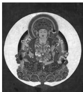
絹本着色虚空蔵菩薩像

文化財は、わが国の歴史・文化の中で育まれ、過去から現在まで長い間守り伝えられてきた貴重な国民的財産です。その中でも特に重要な文化財・指定文化財は市内に34件あります。今回の企画展では、江戸時代中頃の名家住宅の面影を今に伝える国指定和井田家住宅を始め、細かい金泥模様など鎌倉時代後期の仏画の特