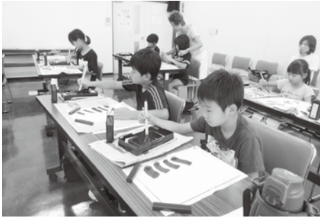
夏休み子ども書道教室

▼7月20日から9月16日までの間、資料館で、第42回企画展「八潮の宝物 指定文化財紹介展」を開催