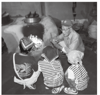
カマドでご飯をたく様子

■11月16日(土) 午前10時～正午 ■対八潮メセナ・アネックス多目的ホールA ■対市内在住で、在宅で介護をしている方、これから介護について学びたい方など ■内仕事と介護を両立するために利用できる制度の案内と、高齢者を介護する際の身体の負担軽減についての技術講習 ■定員20人程度(申込順) ■無料 ■内南部地域包括支援センター埼玉回生病院(☎999・7717)へ ■内長寿介護課 ☎448