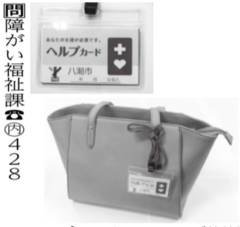
ヘルプカードケースおよび装着例