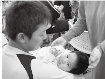
研究発表会(いのちの授業)の様子

市内全校で推進する小中一貫教育は、14年目を迎えました。11月19日(火)に、八潮中学校ブロック(潮止小学校、松之木小学校、八潮中学校)において「学力・体力の向上と豊かな心を育成する小中一貫教育の推進」『深まる授業・高まる学力』夢実現に向けた「学びのドリムプラン」の研究主題の下、研究発表会を開催しました。