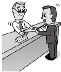
金融機関への調査

都市農業経営研修会 令和2年1月18日(土) 午前9時30分～(受付は午前9時15分) 場 JAさいかつ潮止プラザ会議室