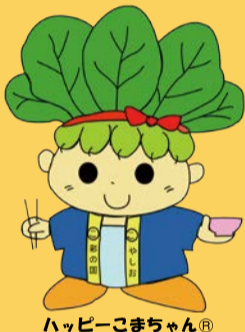
ハッピーこまちゃん®

皆さんの投票のおかげで昨年の194位から大きく順位を上げることができました。これからもハッピーこまちゃんの応援をよろしくお願いします。