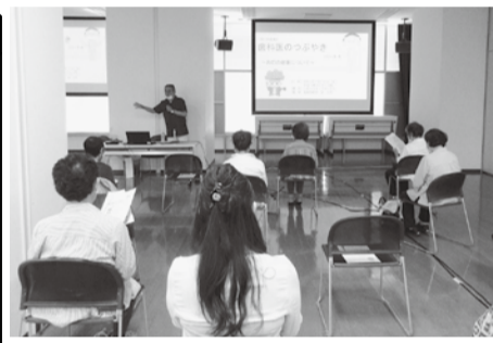
口腔に関する介護予防講演会

▼8月6日から12日までの間、アネックスで、「口腔に関する介護予防講演会」を開催