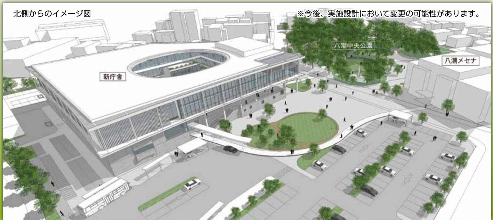
北側からのイメージ図