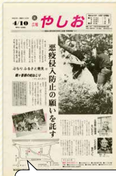
ロゴは赤字の斜体