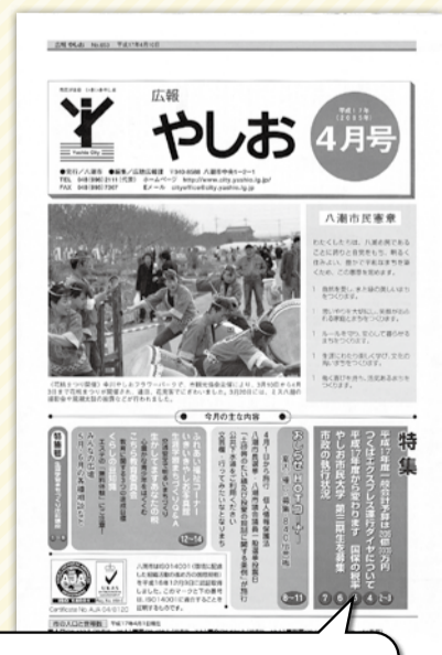
ロゴ周辺部分は広くスペースを取り、背景は白地