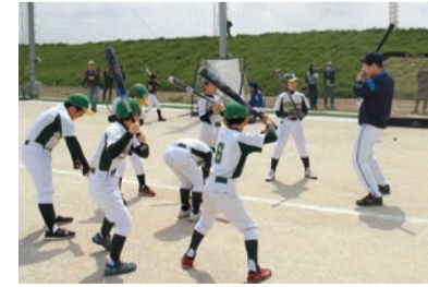
中川やしおスポーツパークで行われた「ベースボールクリニック」

●埼玉西武ライオンズ bluelegends (ブルーレジェンズ) とは 球場でのダンスパフォーマンスやファンサービスを通して、ファンとの絆を紡ぐ埼玉西武ライオンズの公式パフォーマンスチームです。