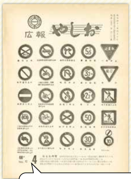
ロゴは筆で描いたような文字