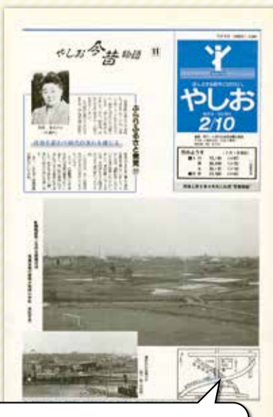
表紙に八潮のシンボルマーク