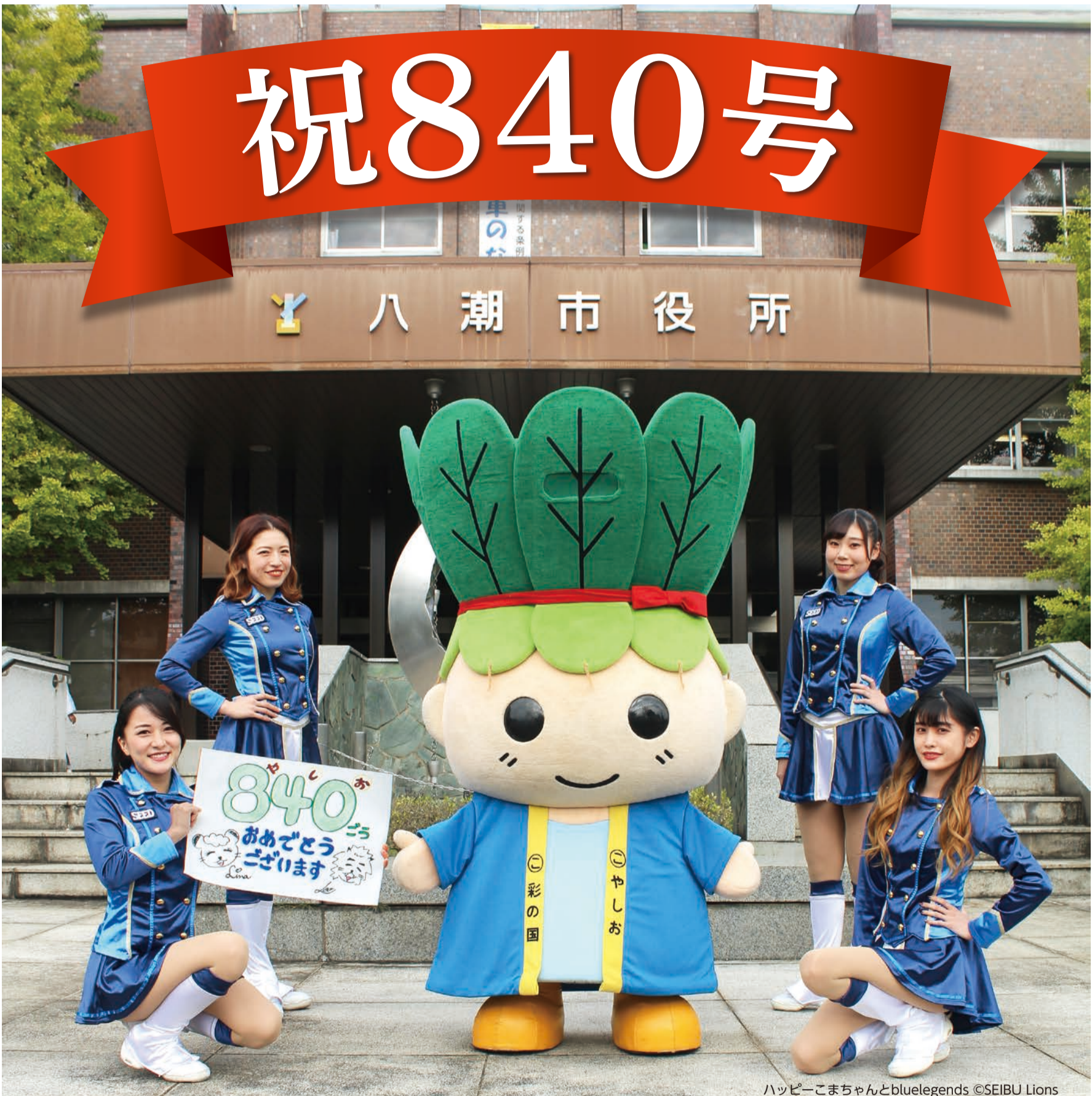
ハッピーこまちゃんとbluelegends

●今月の主な内容● 2面：広報やしおリニューアル／3面：ペットボトルの収集方法の変更／4面：児童虐待防止月間／介護の日、人生会議の日