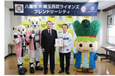
協定締結後、埼玉西武ライオンズマスコットのレオ・ライナ、ハッピーこまちゃんと一緒に記念撮影

市と(株)西武ライオンズは、平成30年に「連携協力に関する基本協定」を締結し、さまざまな協働事業に取り組んでいます。