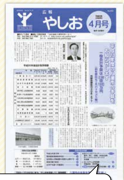
1色刷りを2色刷りに変更