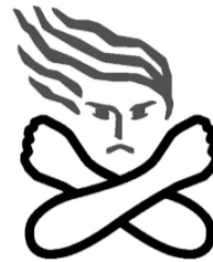
女性に対する暴力根絶のためのシンボルマーク

この機会に男女のあり方を見直し、より良い男女共同参画社会をつくっていきましょう。 ※11月25日は「女性に対する暴力撤廃国際日」