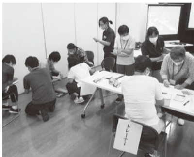
フレイルサポーター養成講座

▼9月1日、4日および11日に、八潮メセナ・アネックスで、県内初の「フレイルサポーター養成講座」を開催し、12人を養成