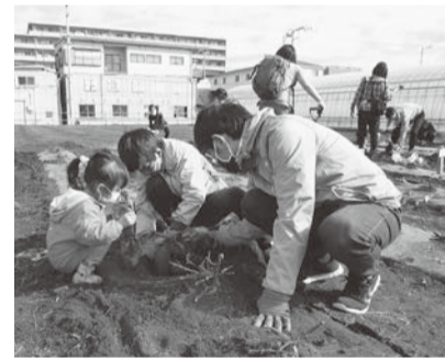
さつまいも親子農業体験