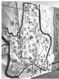
八潮市制施行50周年記念事業第30回八潮市書道展「八潮の地図を筆文字で埋めよう」

現在、八幡公民館は大規模改修工事のため休館中ですが、今年度は文化協会主催イベントと併せた講座を展開していく予定です。今後も新型コロナウイルス感染症の感染拡大状況を見据え、防止対策を徹底しながら、新たな日常の中で何ができるかを考え、地域の芸術文化の振興を図っていきます。