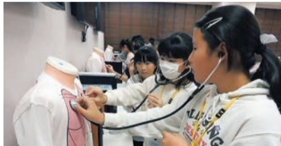
令和元年度の体験学習の様子

市内の学校に在学している小学校5年生から中学校1年生を対象に、4つの大学で体験学習や施設見学を行います。