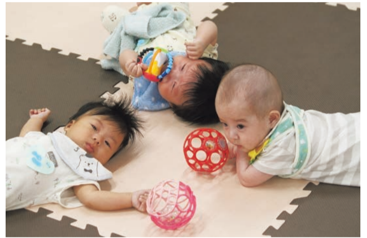
駅前子育てひろば

●ファミリー・サポート・センター 日(月)～土曜日(祝日を除く) 午前9時30分～午後4時30分 対生後おおむね6カ月から小学校6年生までのお子さんがいる方 ◆入会説明会 日(火) 午後1時～2時 対お子さんの援助を希望する方、援助ができる方 ◆提供会員講習会 日(火) 午後2時～4時 対援助ができる方 問☎951-0312 ●ホームスタート(訪問型支援) 日(月)～金曜日 午前10時～午後4時 対就学前の子育て親子 問☎951-0269 ●駅前子どもの相談窓口(保育士相談) 日(火) 午前10時～11時30分 対おおむね3歳未満の児童と保護者 問☎951-0285