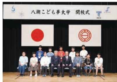
令和4年度開校式の様子