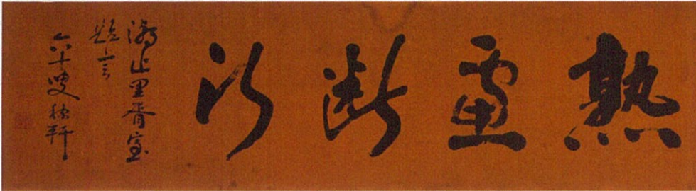
田中四一郎筆「熟慮断行」 さいかつ農業協同組合蔵