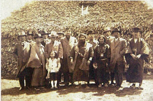
北海道産業組合視察団写真