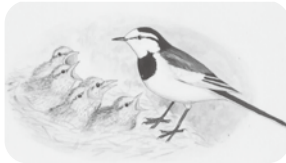
市の鳥 ハクセキレイ