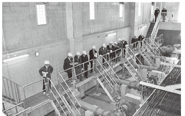
(場所) 八潮市水道部敷地内

また、所管事項の調査のため、現地視察を行いました。○中央浄水場配水施設更新事業について