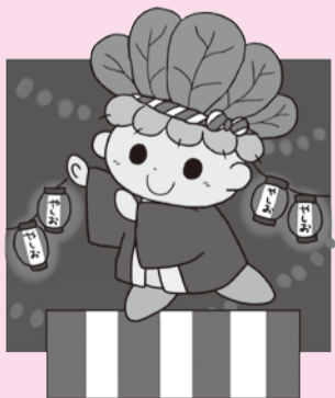
ハッピーこまちゃん