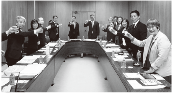
条例に基づいて、那須塩原市特産の牛乳で乾杯しました(左記写真)。