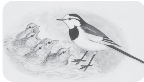
市の鳥 ハクセキレイ