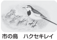
市の鳥 ハクセキレイ