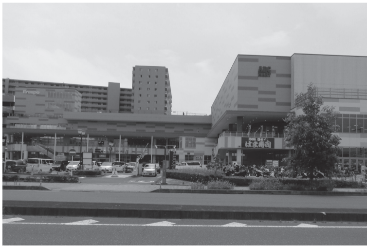
(令和2年6月末日現在)