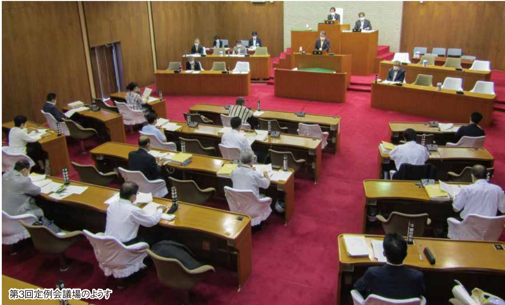
第3回定例会議場のようす