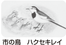
市の鳥 ハクセキレイ