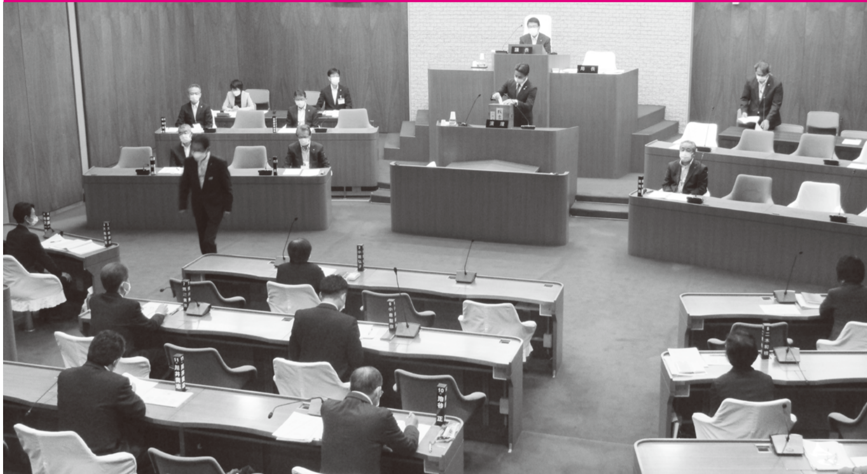
▶副議長選挙のようす(感染症対策のため、議席の間隔をあけています。)