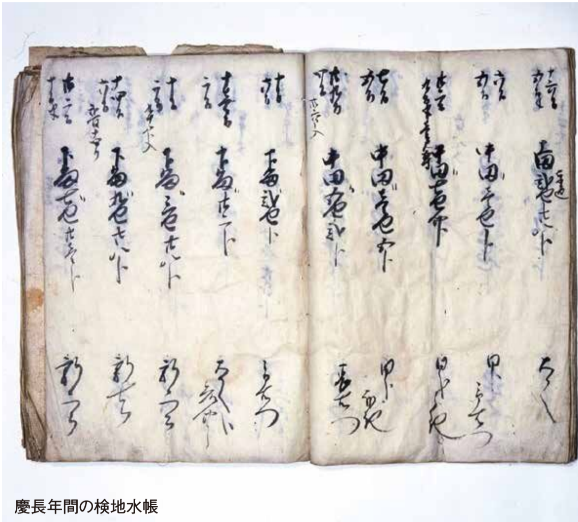
慶長年間の検地水帳