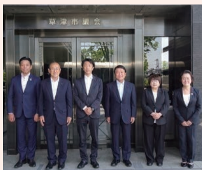
滋賀県草津市役所