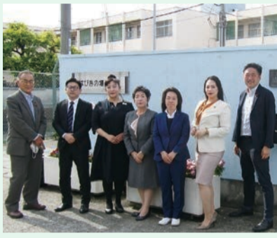
大阪府羽曳野市立はびきの埴生学園