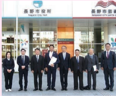
長野県長野市役所