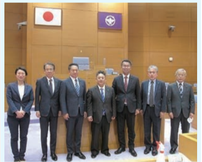
大阪府茨木市役所(議場)

実際には、地方公共団体情報システム機構(J-LIS)のシステム改修が2023年10月に終了する予定とのこと、また、それぞれのコンビニ端末のソフトウェア更新などにも必要になることから、年内をメドに利用でき