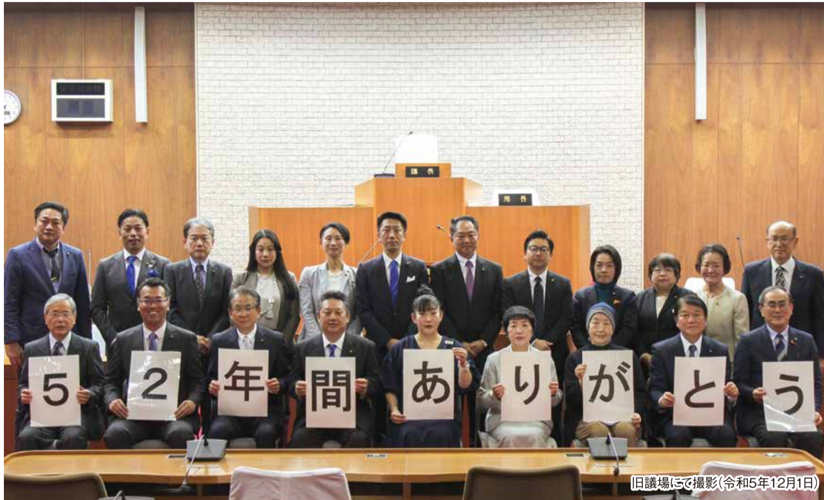
旧議場にて撮影(令和5年12月1日)