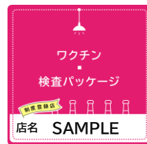
登録店ステッカー