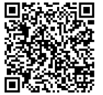
ワクチン・検査パッケージ 県ホームページ