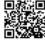
埼玉県PCR検査等 無料化事業 ホームページ