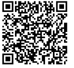
PCR検査等無料化に 関するご案内 ホームページ