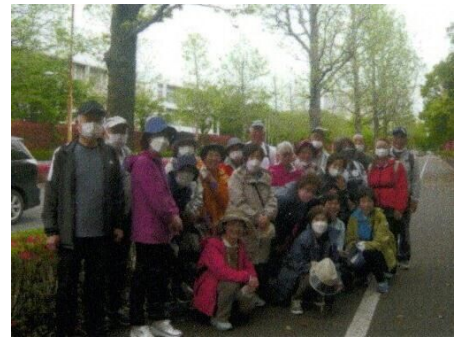
柏の葉キャンパスの街路樹前で

駅で降り、十余第一公園→こんぶくろ公園(自然博物館公園)→国立がんセンター病院前→東京大学柏キャンパス前とウォーキングしました。あいにくの小雨でしたが、芽吹いた木々の中を歩くのはとてもさわやかで、心と身体がリフレッシュできました。