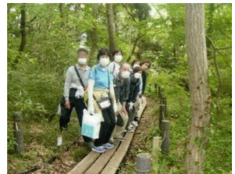
こんぶくろ公園(自然博物館公園)

柏の葉公園で部会の総会(令和3年度活動報告・令和3年度会計報告・令和4年度活動計画「テーマ<脚腰の強化>」)を開催しました。その後、昼食会場「三井ガーデンホテル」にて、イタリアン料理と生ビールを美味しく頂き、立案者に感謝を言いたいです。