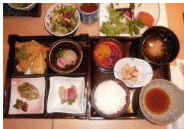
パリパリの牡蠣フライ

*今回も、みんなと一緒に歩くことで、たくさん歩くことが出来ました。そして楽しかったです。*