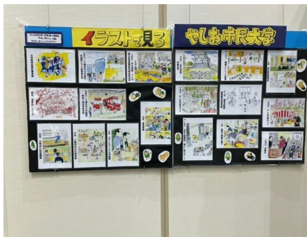
市民大学をイラストで紹介