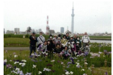
堀切水辺の公園にて