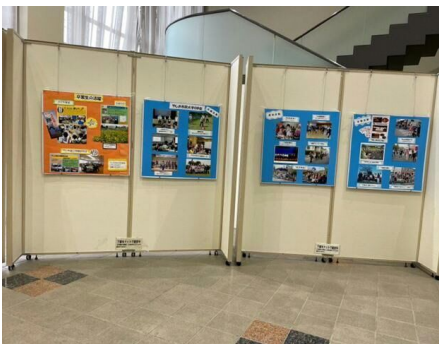
市民大学OB会の紹介