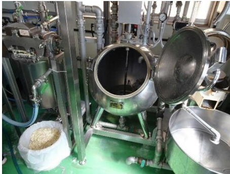
左から絞り器、釜、グライダー