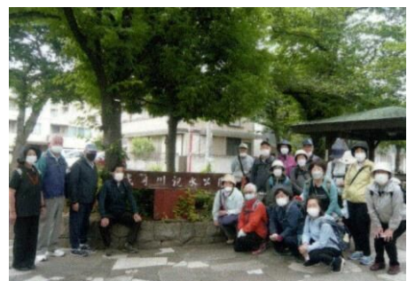
曳舟川親水公園前