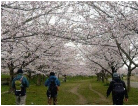
花咲く桜のトンネル

るのかと私はウキウキしながら目的地に向かいました。おたかの森駅から出発して柏まで、幾つかの公園を通りどれだけ沢山の桜を見たでしょうか？ 覚えているのは吉野桜。どの桜も綺麗で見事。桜の花びらの色が違うことに気付きました。食事は竜宮城の和食。熱々パリパリの牡蠣フライ。