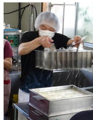
豆腐を切り分ける