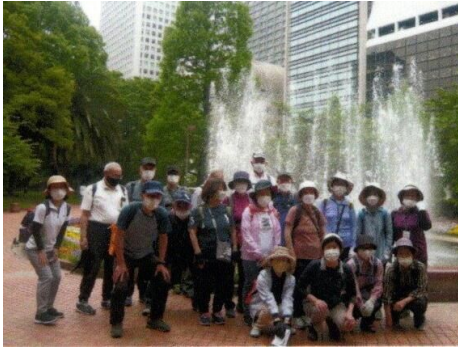
日比谷公園の噴水前

今回の反省点としては、集合場所の北千住で千代田線に発車間際に急いで乗り込み、男子勢(自分も含め)6人が先にスタートしてしまい、一時後続との連絡が取れなくなっ