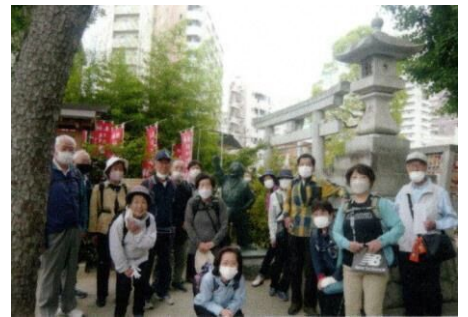
道祖神社前、奥は「両津」像