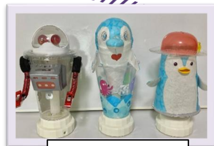
※写真は作品見本です。