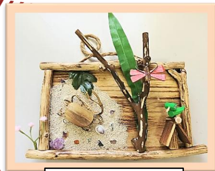
※写真は作品見本です。