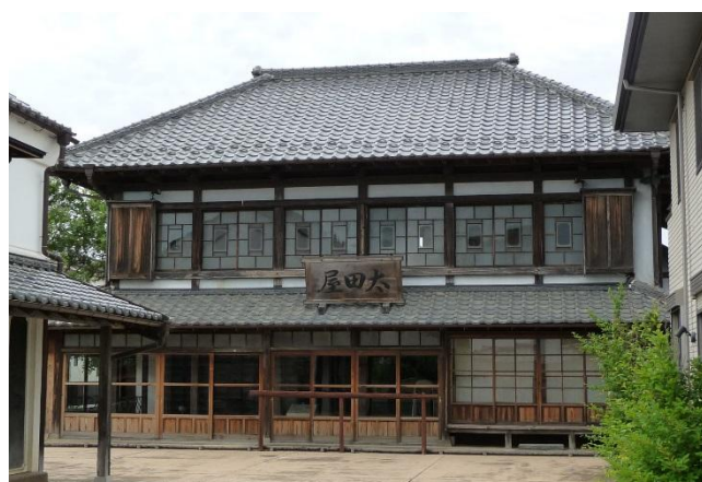
太田家住宅・蔵 (市指定有形文化財(建造物))