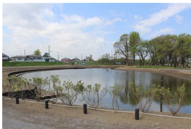
中川やしお水辺の楽校