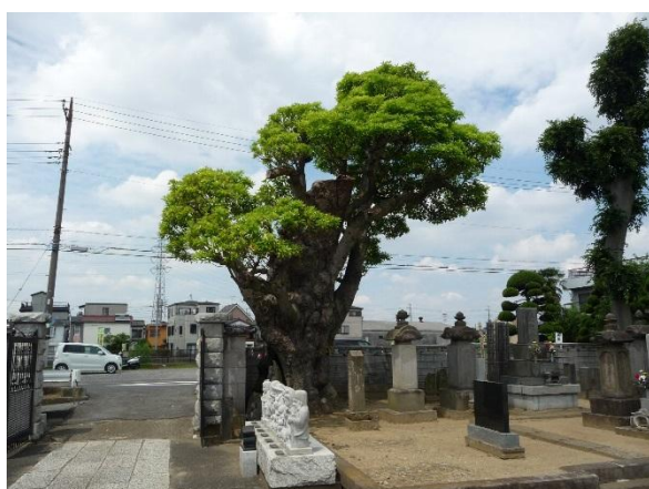
西福寺のタブノキ (市指定天然記念物)