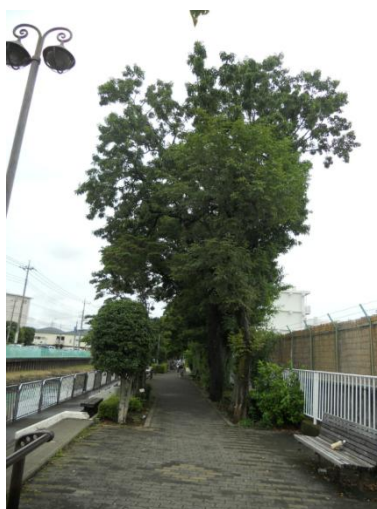
松之木公園のどんぐり遊歩道

既存建築物について、「建築物エネルギー消費性能基準」（建築物のエネルギー消費性能の向上に関する法律第 2 条第 3 号）に適合している旨を規模等により所管行政庁（県または市）に認定申請するもの。