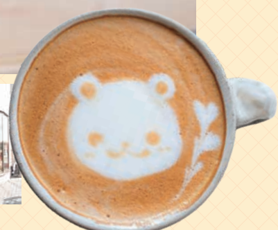
スペシャルティコーヒー