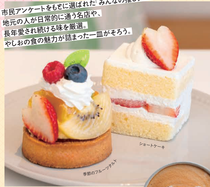
季節のフルーツタルト

市民アンケートをもとに選ばれた「みんなの推しグルメ」。 地元の人が日常的に通う名店や、 長年愛され続ける味を厳選。 やしおの食の魅力が詰まった一皿がそろろう。