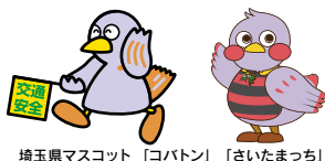
埼玉県マスコット「ロボトン」「さいたまっち」