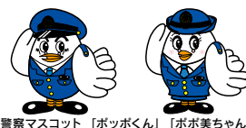
埼玉県警察マスコット「ポッポくん」「ポポ美ちゃん」