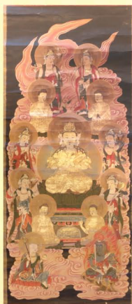
十三仏掛軸（清勝院蔵）