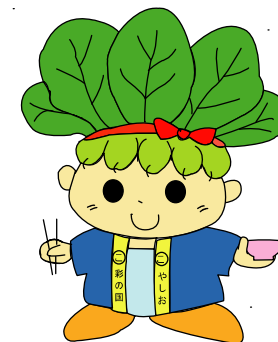
ハッピーこまちゃん®